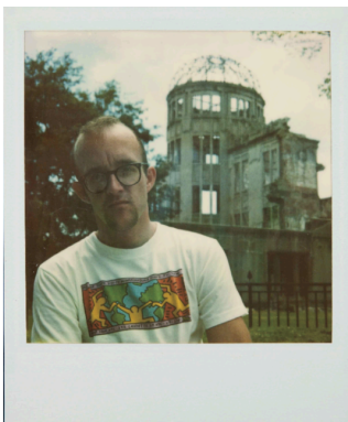
キース・ヘリングと原爆ドーム、1988年

1988年、ヘリングは、広島で行われた原爆養護ホーム建設のためのチャリティコンサート「HIROSHIMA '88」のメインイメージを手がけたことをきっかけに、広島を訪れました。原爆ドームや広島平和記念資料館へ足を運び、戦争の惨さを目の当たりにしたヘリングは、平和への思いを形にすべく壁画制作を申し出ました。しかし、このプロジェクトは実現することがありませんでした。本展では、調査のなされてこなかったヘリングの広島訪問の経緯を辿り、その足跡を紹介します。