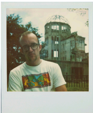
キース・ヘリングと原爆ドーム、1988年

1988年、ヘリングは、広島で行われた原爆養護ホーム建設のためのチャリティコンサート「HIROSHIMA '88」のメインイメージを手がけたことをきっかけに、広島を訪れました。原爆ドームや広島平和記念資料館へ足を運び、戦争の惨さを目の当たりにしたヘリングは、平和への思いを形にすべく壁画制作を申し出ました。しかし、このプロジェクトは実現することがありませんでした。本展では、調査のなされてこなかったヘリングの広島訪問の経緯を辿り、その足跡を紹介します。