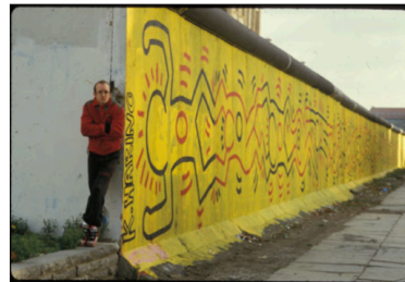
ベルリンの壁での壁画制作のドキュメント写真、1986年