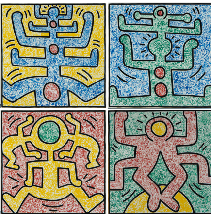
《平和I-IV》、1987年、多摩市文化振興財団蔵