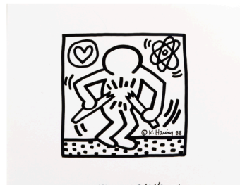
IMAGE FOR DISARMAMENT - APRIL 14 88 © K. Haring 《軍備縮小のための図》、1984年 ©Keith Haring Foundation