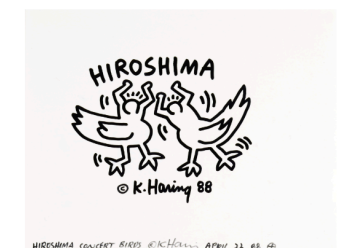
HIROSHIMA CONCERT RINGS © K. Haring APRIL 22 88 《広島コンサート・バース》、1984年 ©Keith Haring Foundation

《軍備縮小のための図》と《広島コンサート・バース》は、いずれもポスターの原画として描かれたドローイングです。《軍備縮小のための図》は1988年にニューヨークで行われた第3回国連軍縮特別総会に合わせて開催された抗議活動のために、《広島コンサート・バース》は同年に広島で行われた被爆者養護老人ホーム建設のためのチャリティコンサート「HIROSHIMA '88」のために描かれました。