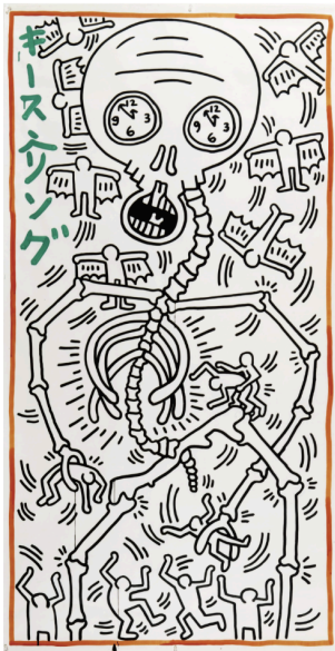
《無題》、1984年

縦1.8mに及ぶ《無題》(2024年6月1日～12月1日の限定公開)には、ヘリングの「アイコン」のひとつである翼の生えた人々が宙を舞い、巨大な骸骨が地上にいる人々を弄ぶ様子が描かれています。コミカルでありながら不気味な空気が漂う本作は、1984年に描かれたドローイングシリーズのうちの一りで、ロサンゼルス美術館「ザ・ボード」で昨年開催され話題となった大規模回顧展「Keith Haring: Art Is for Everybody」へも出品されました。この前年に初来日を果たしたヘリングによるカタカナの署名には、ヘリングと日本との繋がりも垣間見えます。