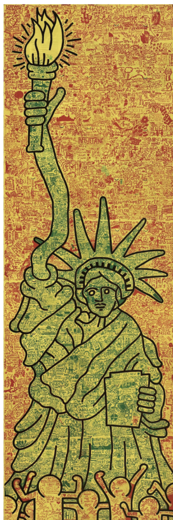
《シティ・キッズ自由について語る》、1986年

この壁画はすぐに他のアーティストらによって上書きされ、1989年11月9日に壁は崩壊しました。本展では、ヘリングの活動を記録し続けたフォトグラファー、ツェン・クウォン・チによる写真やキース・ヘリング財団所蔵の映像を通して、その制作風景や人々と交流するヘリングの姿をご紹介します。